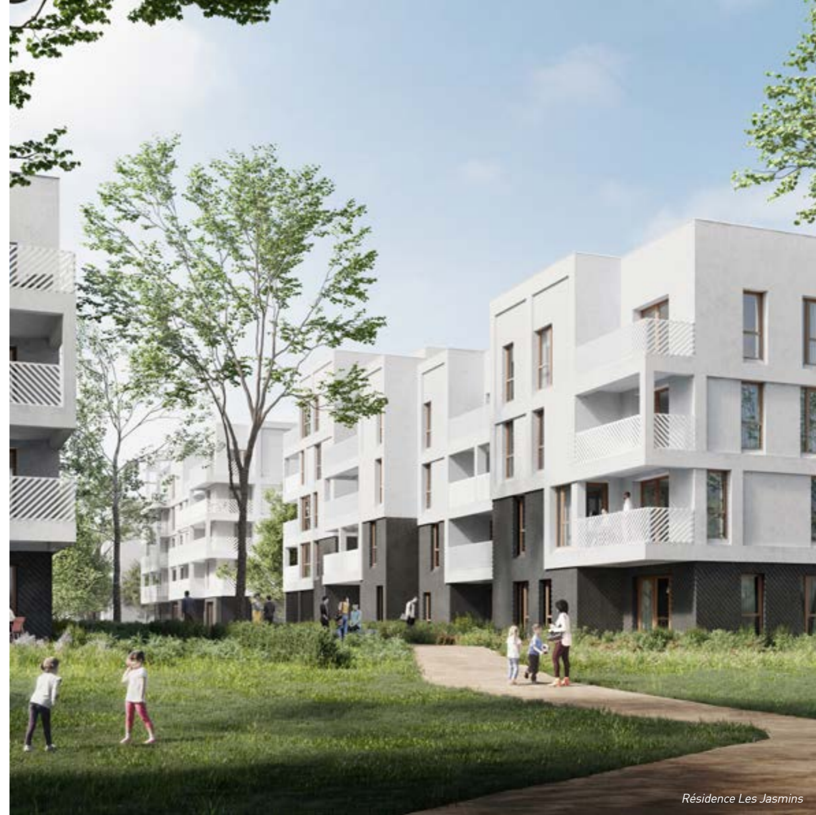
Résidence Les Jasmins

*inclus dans un ensemble de 87 appartements dont 24 locatifs sociaux