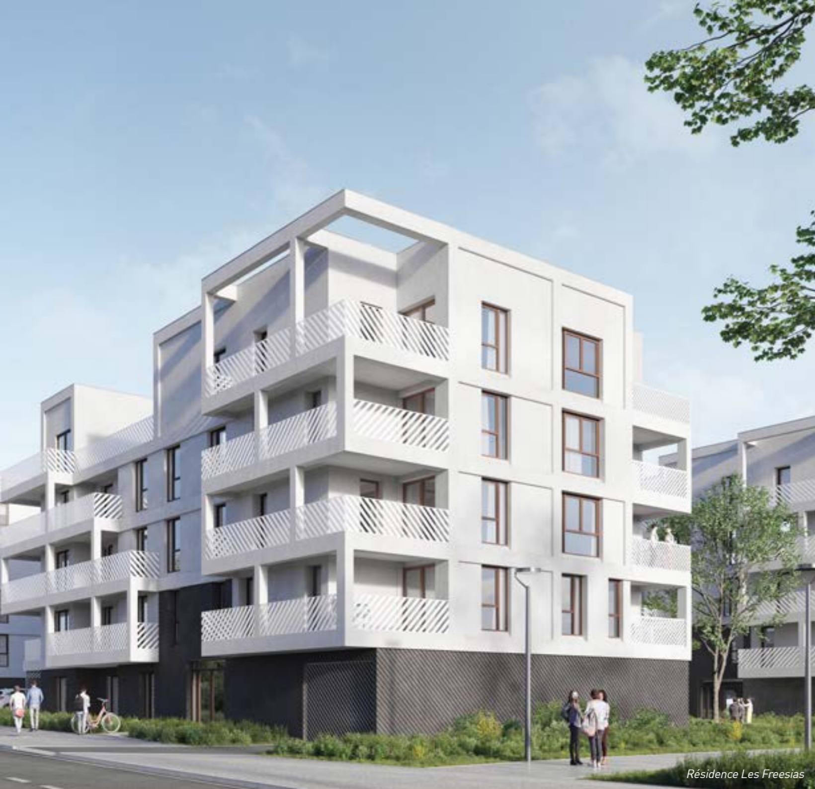
Résidence Les Freesias